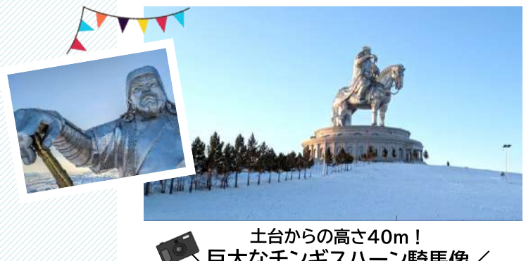
土台からの高さ40m！ 巨大なチンギスハーン騎馬像！