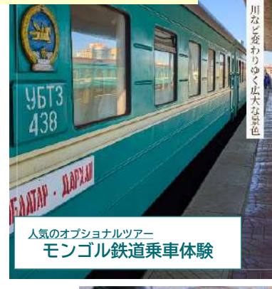
人気のオプションツアー モンゴル鉄道乗車体験

都心を出発して、鉄道旅はいかがですか? お茶を飲んだり、お弁当を食べたり... 数時間たって大きな町は現れません。 異次元な大自然を楽しめる鉄道の旅は、 贅沢で時が止まったような時間です。 地元の方に声をかけて、交流するのもお勧め!